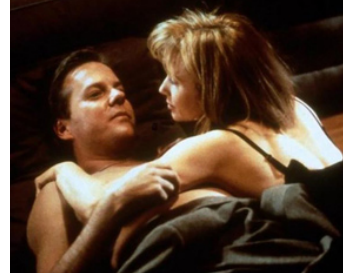
2000 L'OMBRE DE LA SÉDUCTION (The Right Temptation) de Lyndon Chubbeck avec R. de Mornay