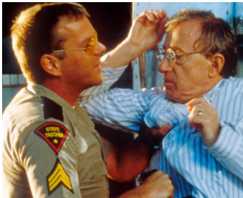
2000 PICKING UP THE PIECES d'Alfonso Arau avec Woody Allen