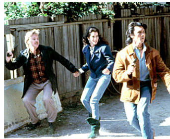
1989 FLIC ET REBELLE (Renegades) de Jack Sholder avec Jami Gertz, Lou Diamond Phillips