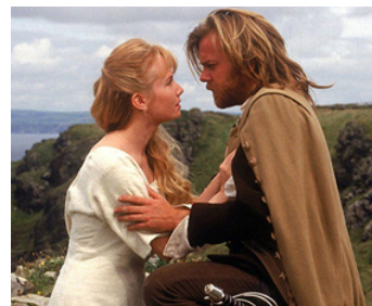
1993 LES TROIS MOUSQUETAIRES (The Three Musketeers) de S. Herak avec Rebecca de Mornay