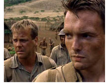
2001 CHUNGKAI, LE CAMP DES SURVIVANTS (To End all Wars) de D. Cunningham avec Ciaran McMenamin