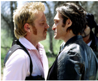
1997 LA DERNIÈRE CAVALE (Truth or Consequences, N. M.) de K. Sutherland avec Vincent Gallo