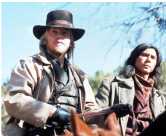
1988 YOUNG GUNS (Young Guns) de Christopher Cain avec Lou Diamond Phillips