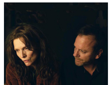
2017 WHERE IS KYRA ? d'Andrew Dosunmu avec Michelle Pfeiffer