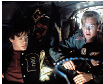
1988 MILLE NEUF CENT SOIXANTE NEUF (1699) d'Ernest Thompson avec Robert Downey Jr