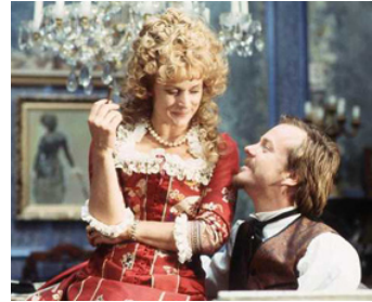
2003 GAUGUIN (Paradise Found) de Mario Andreacchio avec Nastassja Kinski