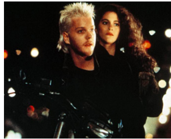
1987 GÉNÉRATION PERDUE (The lost Boys) de Joel Schumacher avec Jami Gertz