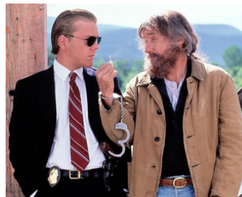
1990 FLASHBACK (Flashback) de Franco Amurri avec Dennis Hopper