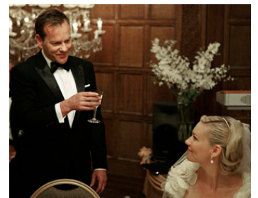
2011 MELANCHOLIA (Melancholia) de Lars von Trier avec Kirsten Dunst