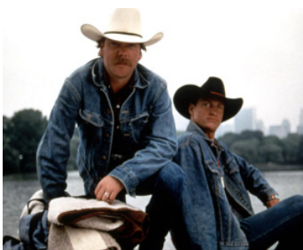
1994 DEUX COW-BOYS À NEW YORK (The Cowboy Way) de Gregg Champion avec Woody Harrelson