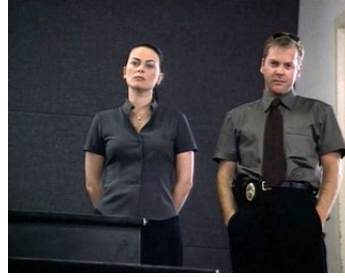
1999 APRÈS ALICE (After Alice) de Paul Marcus avec Polly Walker