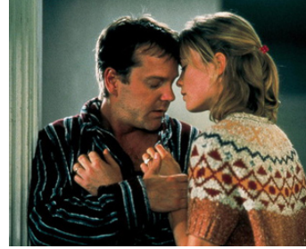
2001 PARI À HAUT RISQUE (Dead Heat) de Mark Malone avec Radha Mitchell