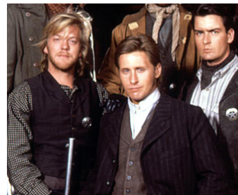
1990 YOUNG GUNS 2 (Young Guns 2) de Geoff Murphy avec Emilio Estevez, Charlie Sheen