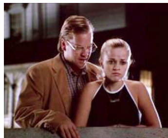
1996 FREEWAY (Freeway) de Matthew Bright avec Brooke Shields