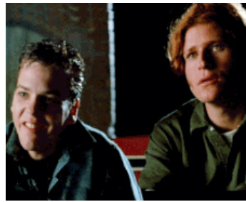
1986 COMME UN CHIEN ENRAGÉ (At Close Range) de James Foley avec Crispin Glover