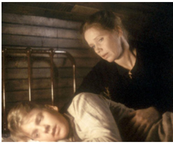
1984 UN PRINTEMPS SOUS LA NEIGE (The Bay Boy) de Daniel Petrie avec Liv Ullmann