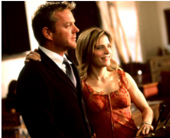
2002 DESERT SAINTS (Desert Saints) de Richard Greenberg avec Melora Walters