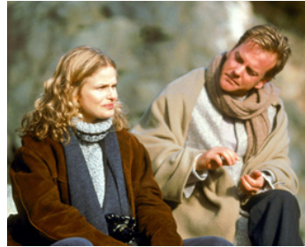
2002 POUR QUELQUES MINUTES DE BONHEUR (Behind the Red Door) de Matia Karrell avec Kyra Sedgwick