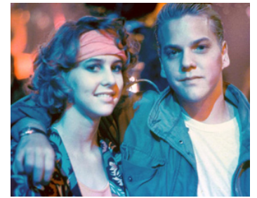
1987 CRAZY MOON (Crazy Moon) d'Allan Eastman avec Vanessa Vaughan