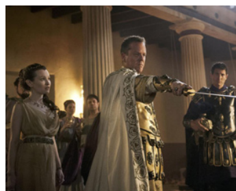
2014 POMPÉI (Pompeii) de Paul W. S. Anderson avec Emily Browning