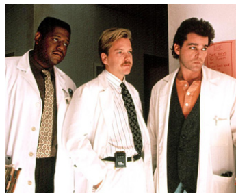
1992 ARTICLE 99 (Article 99) de Howard Deutch avec Forest Whitaker, Ray Liotta