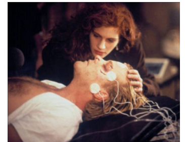
1990 L'EXPÉRIENCE INTERDITE (Flatliners) de Joel Schumacher avec Julia Roberts