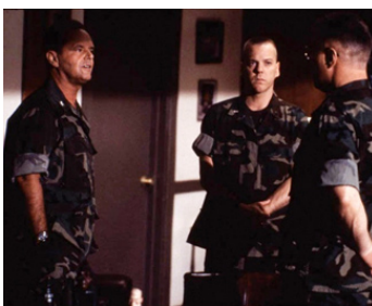
1992 DES HOMMES D'HONNEUR (A Few Good Men) de Rob Reiner avec Jack Nicholson