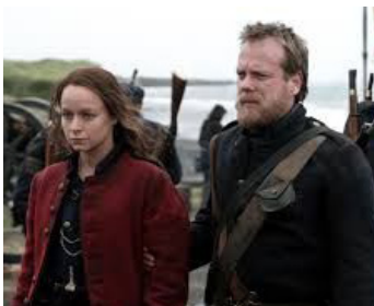
2005 RIVER QUEEN (River Queen) de Vincent Ward avec Samantha Morton