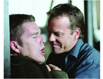
2004 DESTINS VIOLÉS (Taking Lives) de D. J. Caruso avec Ethan Hawke