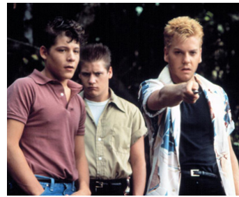
1986 STAND BY ME (Stand by me) de Rob Reiner avec Bradley Gregg, Jason Oliver