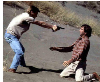
1987 L'HEURE DU CRIME (The Killing Time) de Rick King avec Beau Bridges