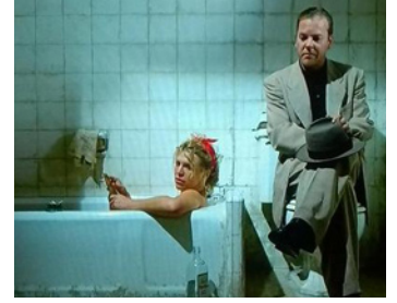
2000 BEAT (Beat) de Gary Walkow avec Courtney Love