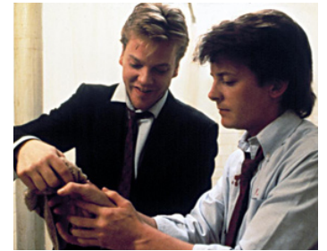
1988 LES FEUX DE LA NUIT (Bright Lights, Big City) de James Bridges avec Michael J. Fox