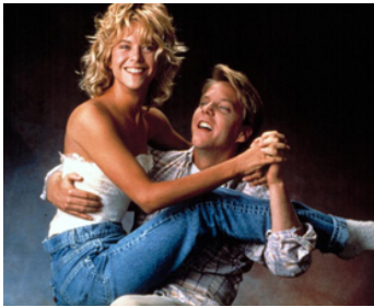
1987 TERRE PROMISE (Promised Land) de Michael Hoffman avec Meg Ryan