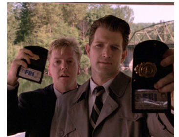
1992 TWIN PEAKS, FIRE WALK WITH ME de David Lynch avec Chris Isaak