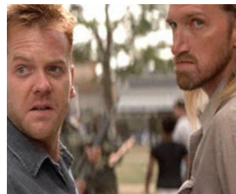
1996 LE DROIT DE TUER ? (A Time to Kill) de Joel Schumacher avec Tim Parati