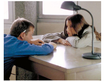
1998 BREAK UP (Break up) de Paul Marcus avec Bridget Fonda