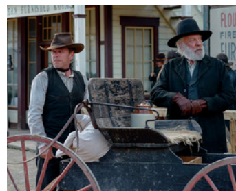
2014 FORSAKEN, RETOUR À FOWLER CITY (Forsaken) de Jon Caesar avec Donald Sutherland